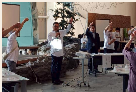
小樽市長の音頭で来場者とともに健康飲料で乾杯タイム

全国の企業や学生も参加し、小樽の未来につながるアイデアの発表もあり、「暮らしたい小樽」へのネットワーク形成にもつながっています。