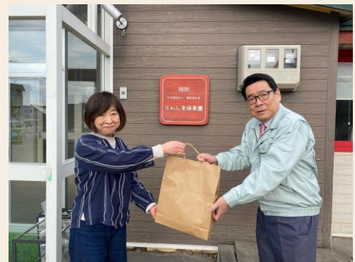
フードドライブ協力事業者様

また、フードバンク用以外の商品も現金で販売し、収益金を就労支援事業所の運営に充てています。