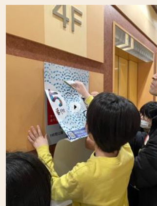
ウイングベイ小樽の施設サインに採用