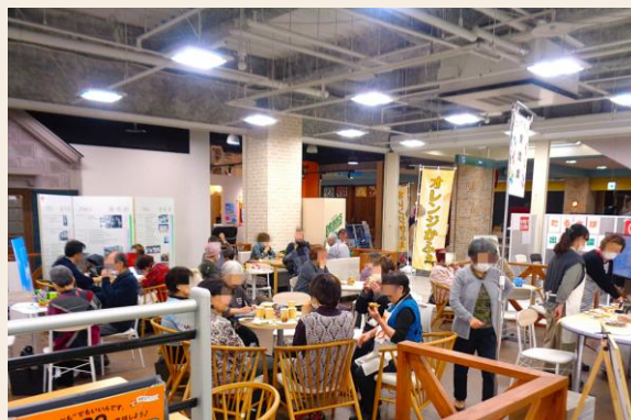
コミュニティスクエア