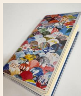
済生会職員手帳の表紙デザインに採用