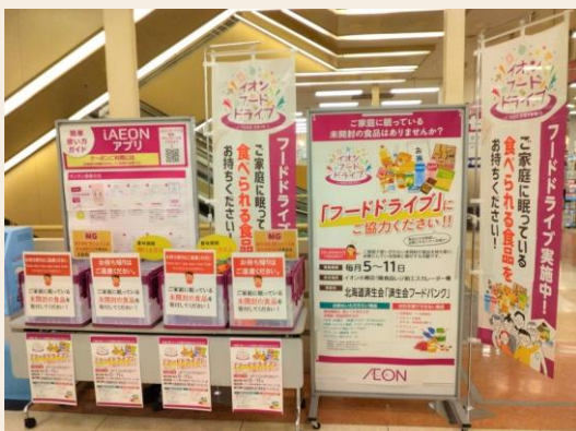
北海道イオン小樽店のフードドライブコーナー