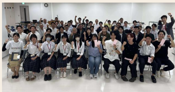
全国のワカモノによる未来共創ドラフト会議