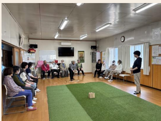
新光地区で活動する「新光コスモス会」