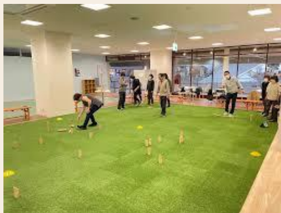
スポーツスクエア

済生会スクエアは、「スポーツスクエア」と「ワークスクエア」「コミュニティスクエア」の三つのエリアで構成されています。スポーツスクエアには、モルックやポッチャといった誰もが楽しめるユニバーサルスポーツの会場を整備。ワークスクエアには、就労支援の場として多様な就労の形を支援しています。コミュニティスクエアは、学生から高齢者まで幅広い世代の交流の場となっています。また、救急カートを設置するなどし、医療必要度の高い障がい者も安心して利用することが可能です。