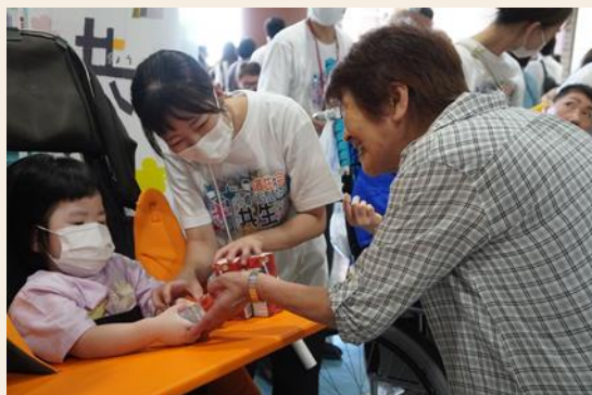
みどりの里入所者からウエルカムドリンクサービス