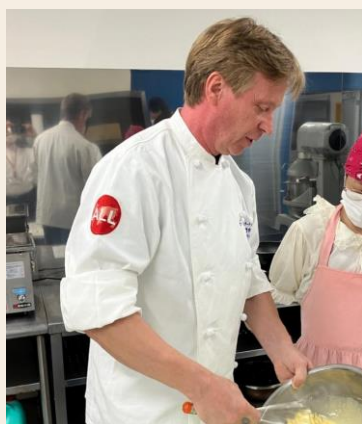
フランスのトップパティシエ グレゴリー氏によるお菓子作り教室