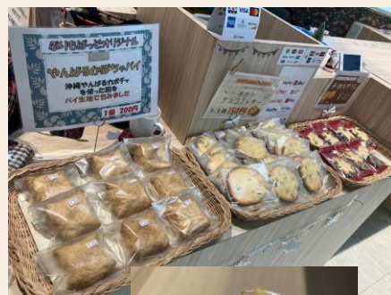
オリジナルサブレとジェラート