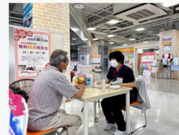
済生会小樽病院健康相談会