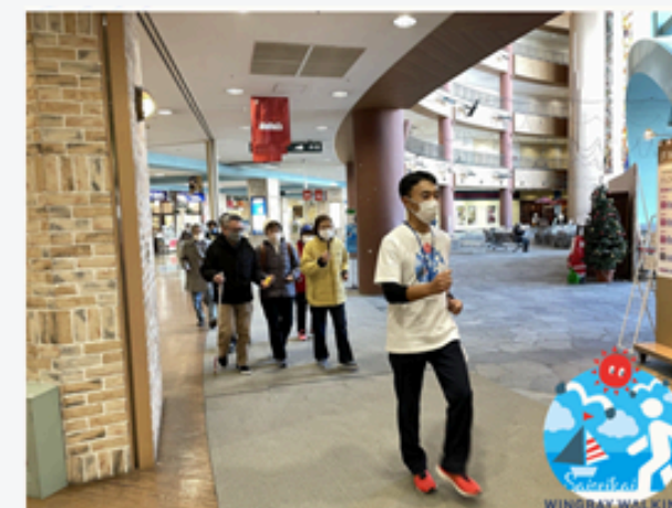
ウイングベイウォーキング