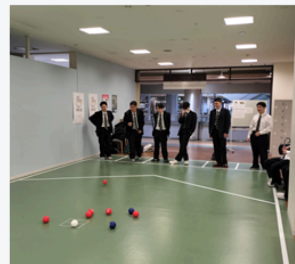
↓ 済生会スポーツスクエア