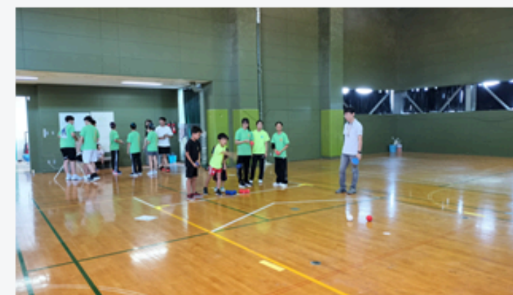
市内イベントで啓蒙活動